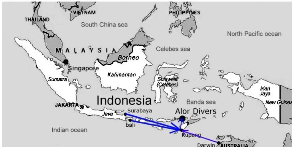
CARTE DES VOLS

Nous sommes disponibles pour vous apporter toutes les informations et avis dont vous pourriez avoir besoin!